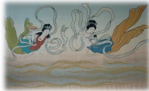
写真はホール舞台の緞帳 （不動堂壁画の天女像をモチーフにしたものです）

初めての方は、住所を確認できるもの（身分証明書・免許証・保険証等）をご持参のうえ、申込用紙に必要事項を記載してください。